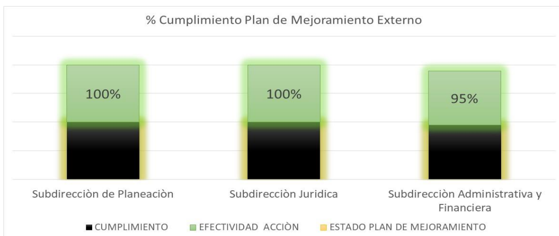
Ilustración 1. Gráfica 1. Estado Plan de Mejoramiento Externo 2020