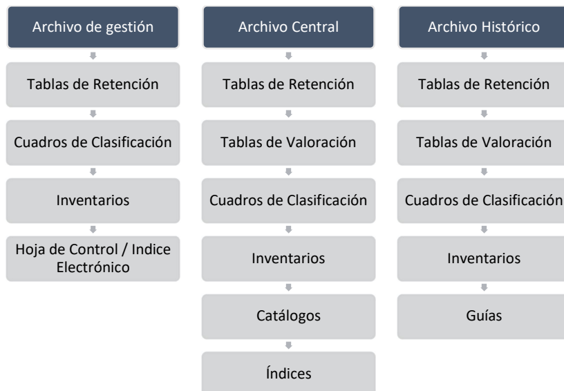
Ilustración No. 3 Instrumentos de descripción desde cada fase del archivo

Por otra parte, es indispensable determinar qué instrumentos de descripción, control y consulta se deben elaborar y mantener actualizados en cada fase del archivo de la siguiente forma: