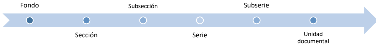
Ilustración No. 1 identificación de unidades de descripción

A continuación, se ilustra la estructura de clasificación de los niveles de descripción: